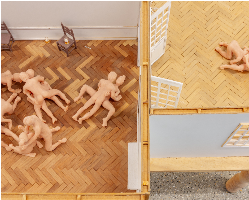
Vue d'exposition « Our Labor, Our Passion, Our Love »; Joan Pallé, Idioterne diorama , 2020, bois, pâte polymère et acrylique, 150x110x90cm, CALM – Centre d'Art La Meute, Lausanne, Suisse, 2024 / Photo: Théo Dufloo / Courtoisie de l'artiste et CALM – Centre d'Art La Meute.