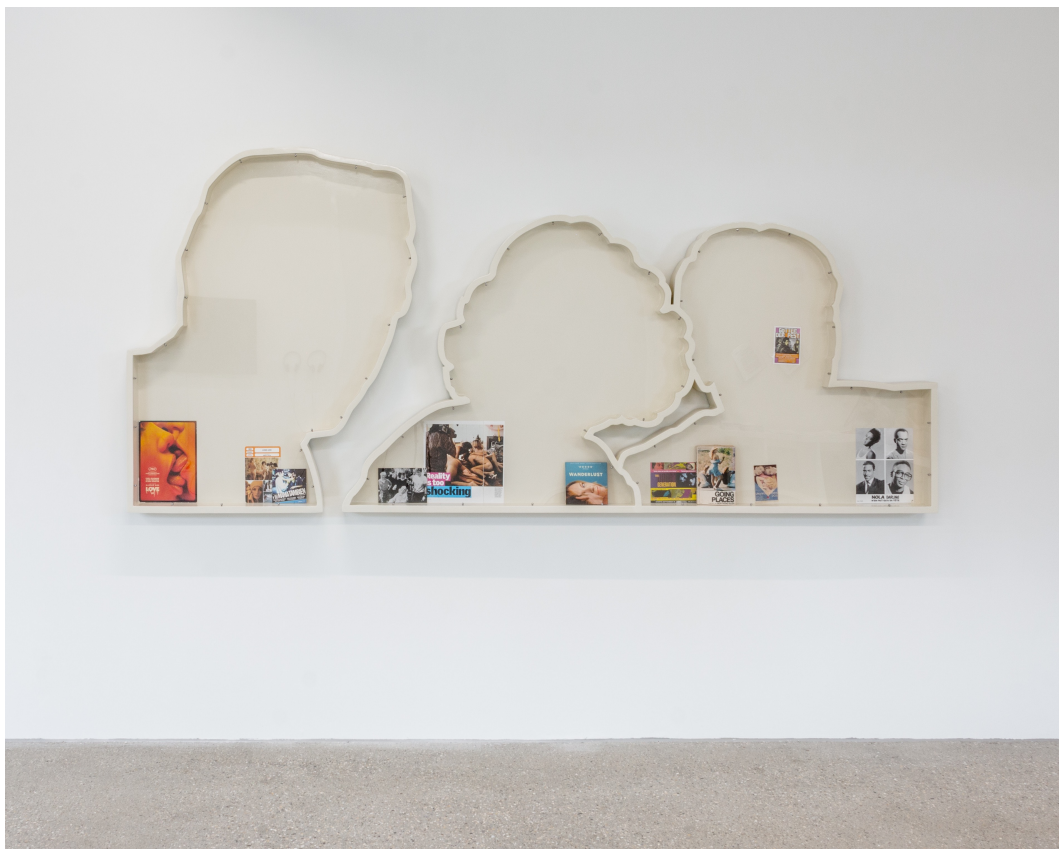
Vue d'exposition « Our Labor, Our Passion, Our Love »; Joan Pallé, Vitrine Design for living , 2022, bois, papier, peinture synthétique et Plexiglas, 300x150x8cm, CALM – Centre d'Art La Meute, Lausanne, Suisse, 2024 / Photo: Théo Dufloo / Courtoisie de l'artiste et CALM – Centre d'Art La Meute.