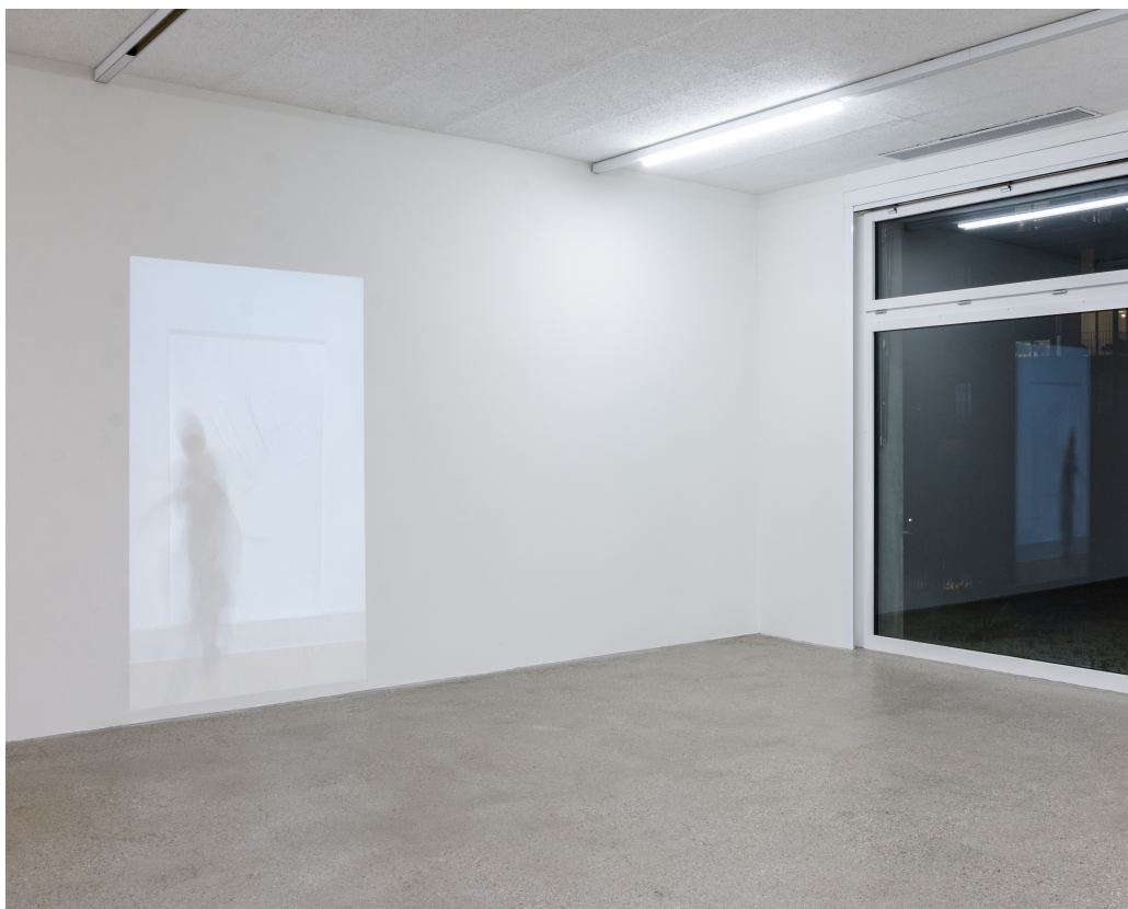
Vue d'exposition « Our Labor, Our Passion, Our Love »; D. Denenge Duyst-Akpem, Rope Beating Drawing , Pastoral Brutalism series, 2022, vidéo de performance privée, corps et gestes de l'artiste, corde, charbon et papier, CALM – Centre d'Art La Meute, Lausanne, Suisse, 2024 / Photo: Théo Dufloo / Courtoisie de l'artiste et CALM – Centre d'Art La Meute.