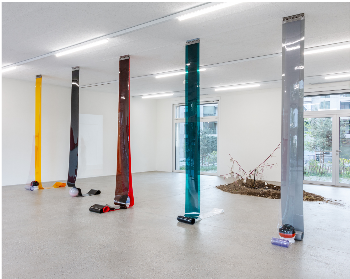
Vue d'exposition « Our Labor, Our Passion, Our Love »; Charly Mirambeau, Private Pursuits and Public Problems , 2024, rail en acier inoxydable, PVC, verre, tissus (cinq éléments), CALM – Centre d'Art La Meute, Lausanne, Suisse, 2024