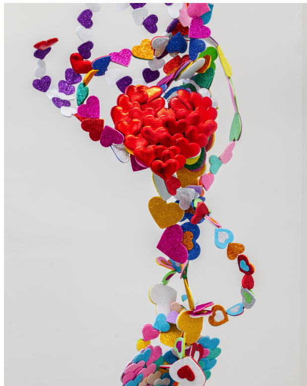
Vue d'exposition « Our Labor, Our Passion, Our Love »; Marisabel Arias, I am only for you , 2024, 240x30x15cm; I am only for you love , 2024, coeurs en éponges, paillettes microporeuses, crochet en aluminium, 25x37x10cm, CALM – Centre d'Art La Meute, Lausanne, Suisse, 2024 / Photo: Théo Dufloo / Courtoisie de l'artiste et CALM – Centre d'Art La Meute.