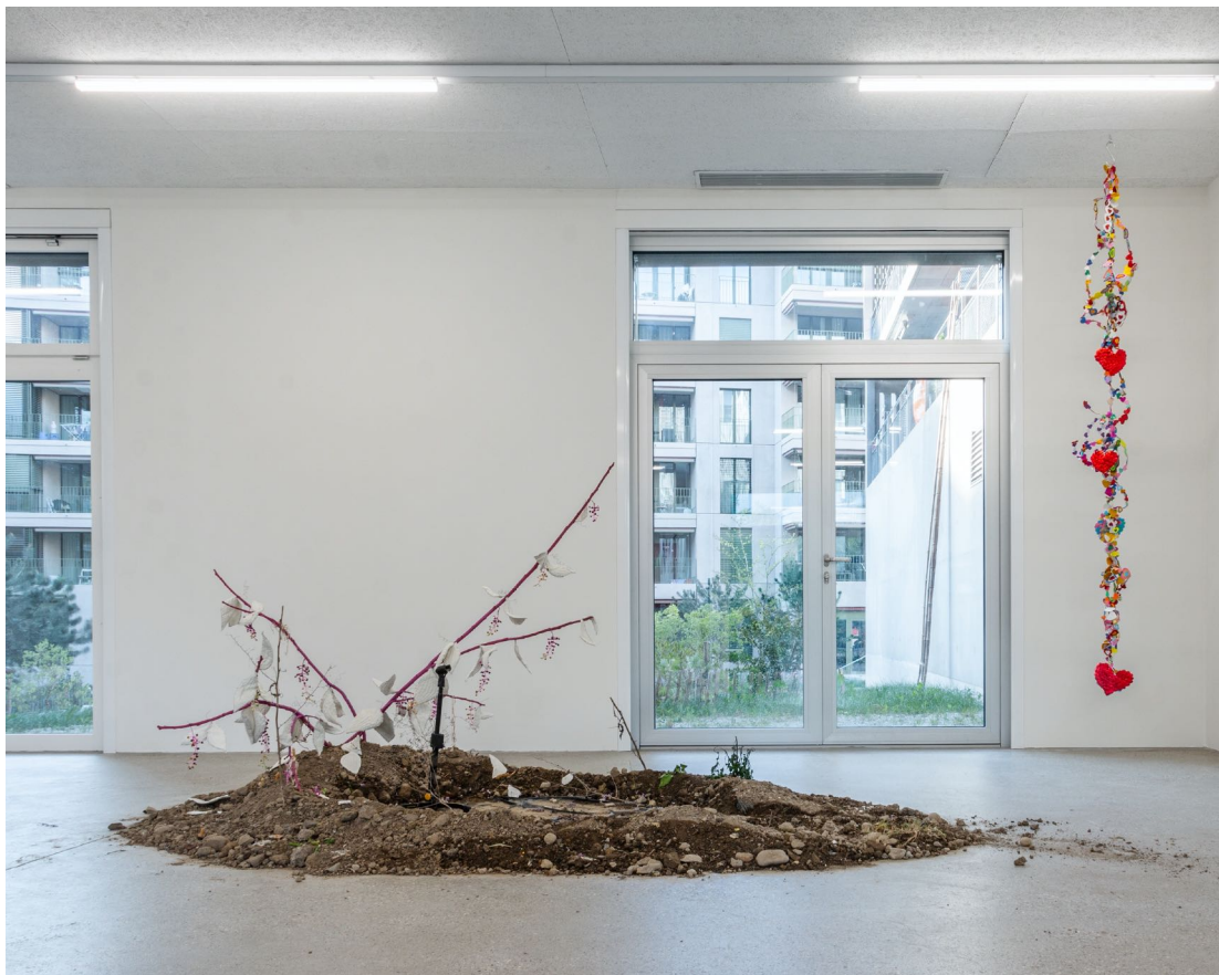
Vue d'exposition « Our Labor, Our Passion, Our Love »; Juri Bizzotto, Phytolacca Vol. 1 , 2024, installation et performance, branches, perles, tissu, microphone, dim. variables, CALM – Centre d'Art La Meute, Lausanne, Suisse, 2024