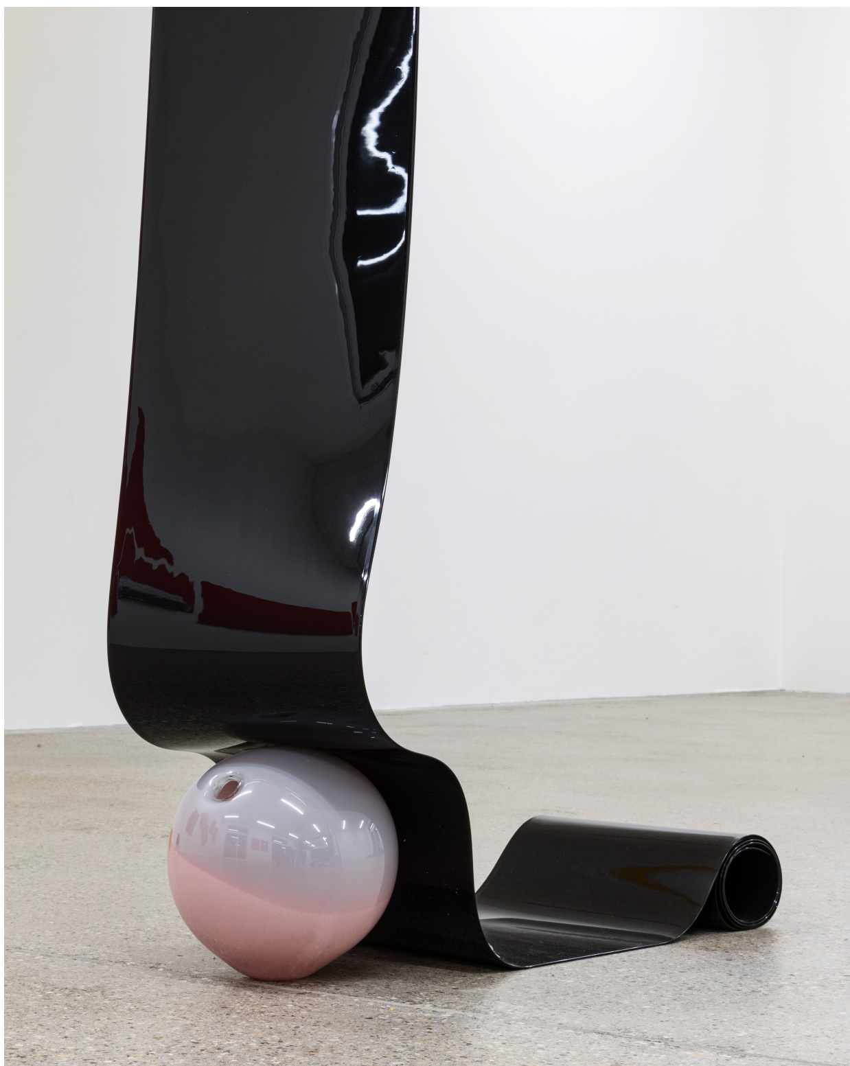
Vue d'exposition « Our Labor, Our Passion, Our Love »; Charly Mirambeau, Private Pursuits and Public Problems (Conditions of Possibility) , détail, 2024, rail en acier inoxydable, PVC, verre, CALM – Centre d'Art La Meute, Lausanne, Suisse, 2024 / Photo: Théo Dufloo / Courtoisie de l'artiste et CALM – Centre d'Art La Meute.