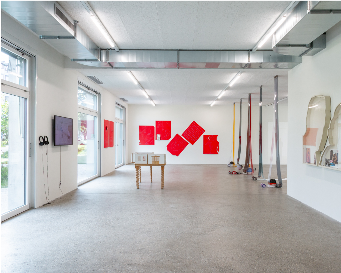
Vue d'exposition « Our Labor, Our Passion, Our Love », CALM – Centre d'Art La Meute, Lausanne, Suisse, 2024