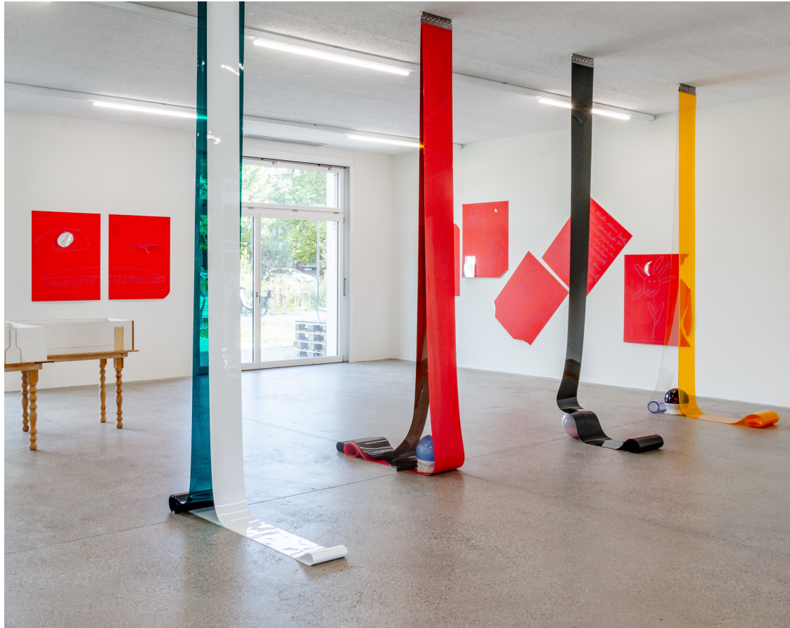
Vue d'exposition « Our Labor, Our Passion, Our Love », CALM – Centre d'Art La Meute, Lausanne, Suisse, 2024