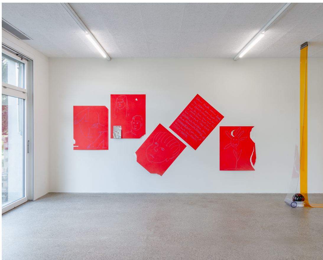
Vue d'exposition « Our Labor, Our Passion, Our Love »; Moritz Krauth, Auntie Mechtild's Red Threat (Some Thoughts She Told me) part 2 , détail, 2023, dessin (pastel à l'huile) sur carton, 101x81 cm (chacun), CALM – Centre d'Art La Meute, Lausanne, Suisse, 2024